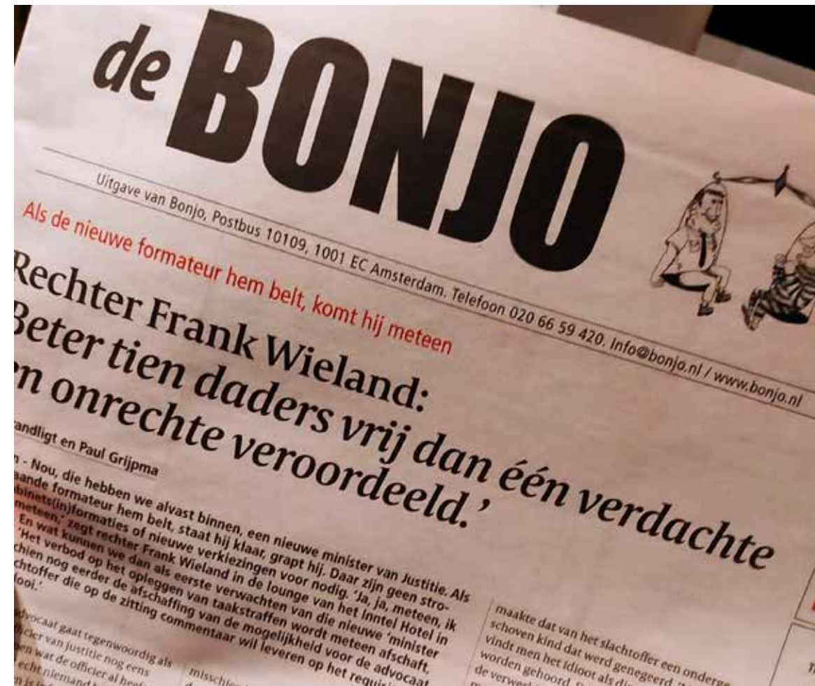
‘Onze krant is uniek in de wereld. Geen land heeft een onafhankelijk blad in de bajes.’

Gewone advertenties staan ook in Bonjo en veel ook, afkomstig uit maar één sector: de strafrechtadvocatuur. 'Kom je er niet uit? Bel dan ons' of iets dergelijks staat er dan boven een kantoorfoto met opvallend vaak jonge blonde advocaten, die soms zelfs Papiaments en Arabisch spreken. Tja, ook hier speelt de